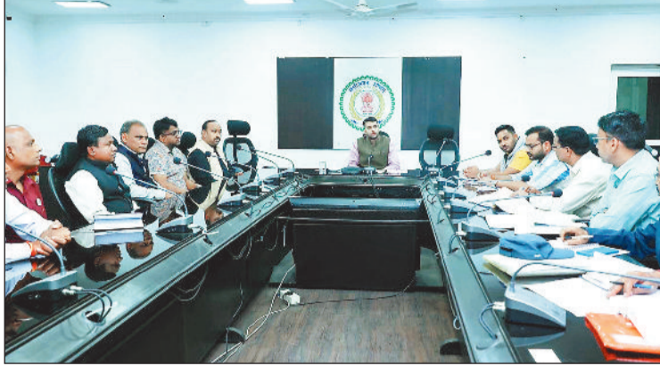
बैठक लेते कलेक्टर।

बैठक के दौरान कलेक्टर ने भू अर्जन एवं पुनर्वास से संबंधित मुआवजा वितरण को मिशन मोड में आगे बढ़ाने के निर्देश अधिकारियों को दिए। उन्होंने प्रभावित ग्रामों के प्रतिनिधियों की समस्याओं को गंभीरता से सुना और उनके त्वरित निराकरण के लिए संबंधित विभागीय अधिकारियों को आवश्यक दिशा निर्देश दिए। साथ ही, उन्होंने परियोजना